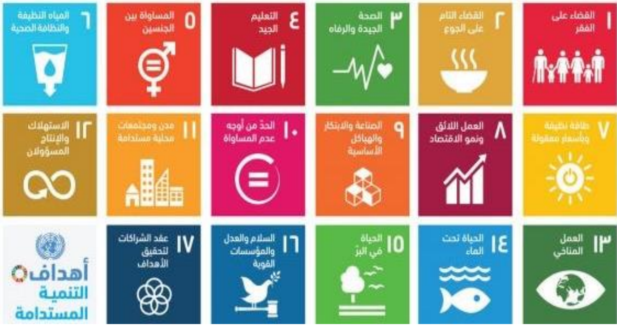
الشكل رقم (1): أهداف التنمية المستدامة

وترى الباحثة أن هذه الأهداف تعد نقطة الانطلاق لتحقيق التنمية المستدامة، ومواجهة التحديات على المستوى العالمي والتي تتعلق بالفقر والجوع وعدم المساواة؛ لضمان تحقيق العيش الكريم للأفراد كافة، كما أنها تساعد أفراد المجتمع في التوحد بالعديد من المعتقدات والأفكار، والانخراط مع بعضهم بعضاً بترشيد استهلاك الموارد المتاحة بما يحفظ حقوق الأجيال القادمة في تلك الموارد، وهذا يتطلب من دول العالم التآزر والتكاتف فيما بينها لتحقيق الاستدامة.